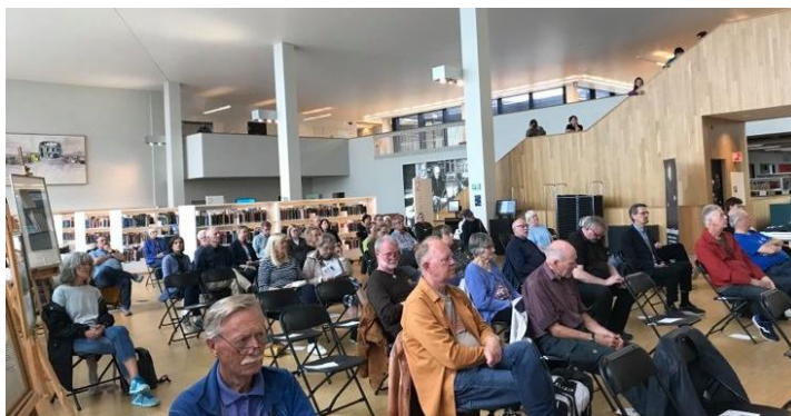
Fullt hus med korona-avstander på Stormen på seminarets første dag.

En hardtarbeidende arrangementskomite sier seg derfor storfornøyd, Vi sender nok en gang en varm takk til de dyktige bidragsyterne som inntok podiet og de flotte samarbeidspartnerne i Bodø og omegn. En takknemlig tanke sendes også til det strålende nordlandsværet som omga oss i tre dager til ende.