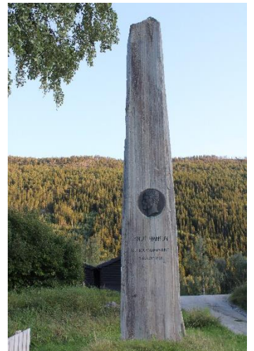
Den majestetiske Hamsun-bautaen står like ved Hamsunstugu.