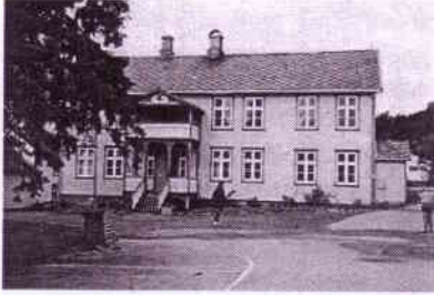
Stiftelsens kontor ligger på Skogheim

Jeg jobber for stiftelsen som daglig leder med kontor på Skogheim, gården Knut og Marie bodde på fra 1911 til 1917. Et inspirerende arbeidssted!