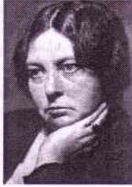
To nobelprisvinnere: Hamsun og Undset