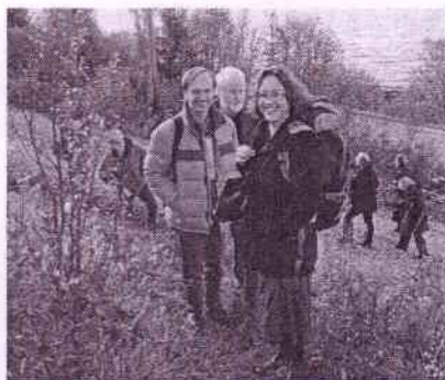
Fornøyde konferansedeltakere på hyttetur

Den strengt faglige del av konferansen ble avsluttet med Michael Schmidts (UiT) Bilde og tekst: Oskar Kokoschkas Pan-illustrasjoner , før alle forelesere og tilhørere gikk til gratis avslutningsmiddag på Humanistisk fakultet. Kort sagt: en kveld med stor stemning og spirituelle taler på løpende bånd!