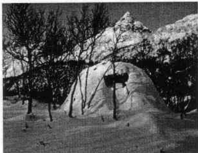
Ny gamme i Egerdal (mellom Hansbakk og Buvåg)

føre et turopplegg/guideoppdrag for en bestemt målgruppe, i dette tilfellet altså barneskolebarn, samt belyse potensiale gammen har der den ligger idyllisk til rett under Egerdalstind, med nydelig utsikt over Hamsundpolden.