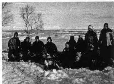
Nydelig utsikt over Hamsund polden

Dagen var kald og klar med snø og solskinn. Ungene fra barneskolen hadde en elev fra videregående med i bussen. Denne var "guide" og informerte underveis om dagens aktiviteter. Det ble selvfølgelig også servering av pølser og saft i gammen og en premieutdeling for god deltakelse. Dagen var en suksess. Både de små og store elevene koste seg i hverandres selskap. Prosjektet fikk tilskudd som et ledd i lokal