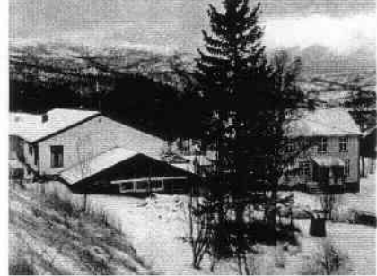
Skogheim (t. h.) ligger i umiddelbar nærhet til byggeforetningen som nå bygger på.

Formannskapet ba om å få utarbeidet en bebyggelsesplan for nærområdet til Skogheim i tråd med stedsutviklingsplanen. I november 2005 stoppet kulturvernsjef Egil Murud i Nordland Fylkeskommune utbyggingen av hensyn til Hamsunminnene i området, men snudde få dager senere. "Vi er kommet til at