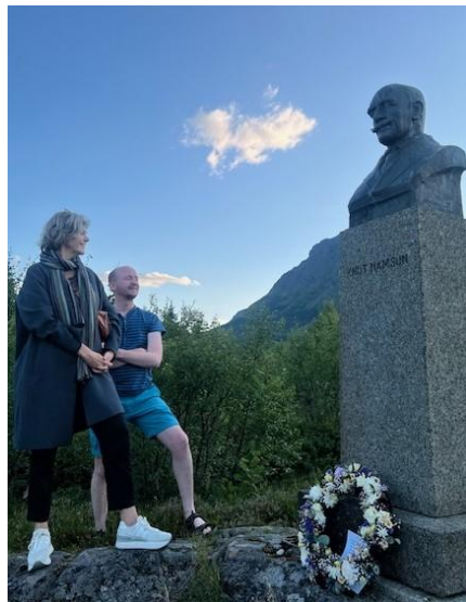
Blomster ved bysten hører med til Hamsuns bursdag 4. august. Her fra 2024.

Selvsagt besørger vi blomsternedleggelse ved bysten i Hamsund på dikterens fødselsdag. I tillegg arrangerer vi som alltid en sosial sammenkomst for medlemmer og andre interesserte på Skogheim på kvelden den 4. august. Der blir det mingling, underholdning, boksalg, Hamsun-quiz, lave skuldre og enkel servering.