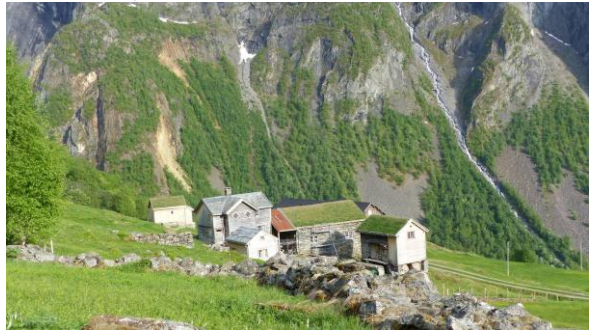
Fjellgården Ormelid i Sogn.