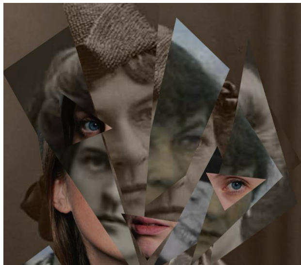
Marie Min