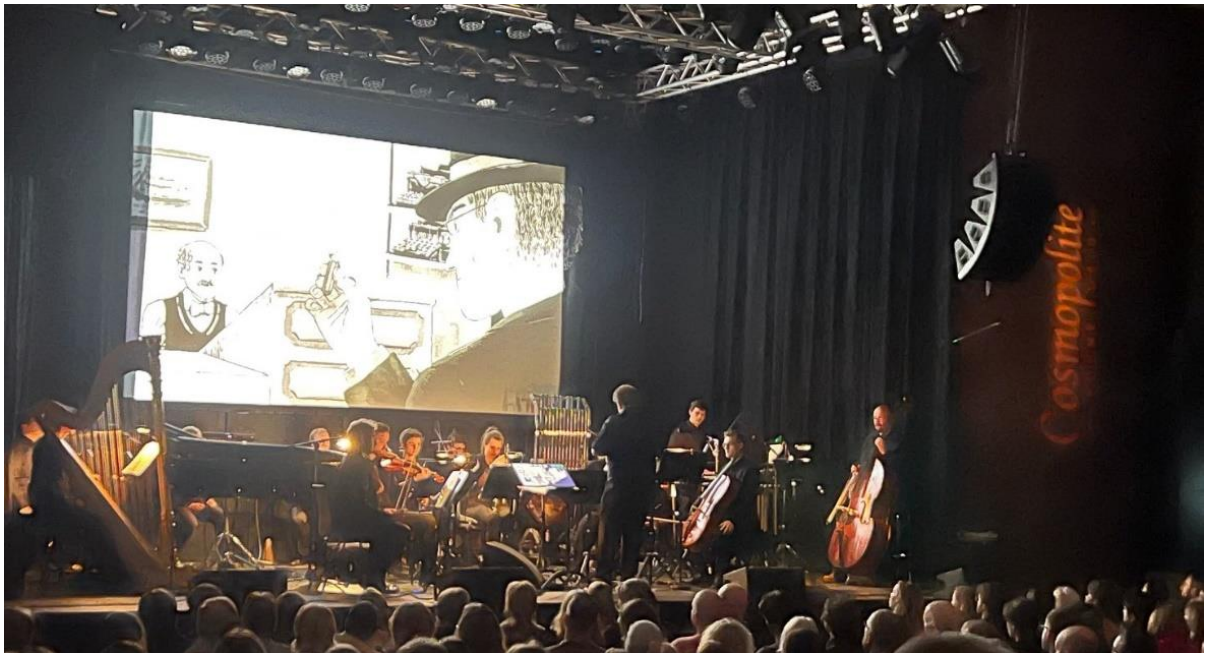
Den norsk Sinfonia og "Sult. En filmkonsert" på Comopolite Scene (tidl. Soria Moria kino) i Oslo.

Vi likte forestillinga, som gikk for fullsatt sal og fortjent ble belønna med stående applaus. De unge musikerne bak prosjektet fortsetter trenden med å dyrke Hamsuns modernisme. Unge mennesker av i dag som i går flytter til storbyene for å dyrke sine akademiske ambisjoner. Mange av dem gjenkjenner seg i Sult -heltens nervøsitet og desperasjon, og kan ha følelser og drømmer som av og til løper løpsk.