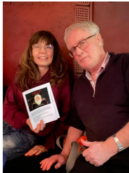
Fornøyde styrefolk på premiere.

Hamsuns Sult fikk i 2019 en grafisk versjon tegna av Martin Ernstsens. Det er nettopp hans tegneserie som danner grunnlaget for den nye animerte novelle-filmen. Ernstsens har ellers tilført filmen noen nye illustrasjoner. Visninga var like mye en musikalsk som en visuell opplevelse: Filmen ble nemlig akkompagnert av et