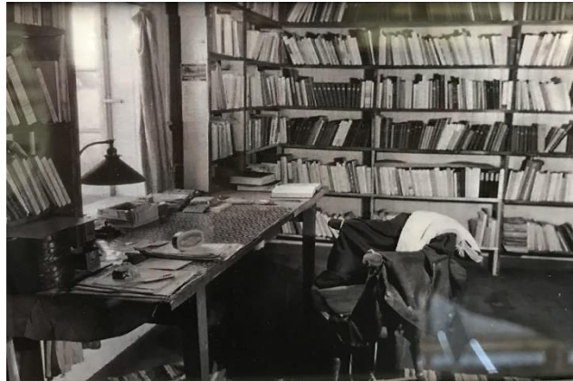
Dikterstuen på Nørholm i 2019 (fargebildet) og interiøret en gang i tiden, ukjent dato