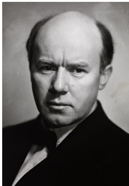
David Monrad Johansen