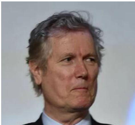
Hans Petter Moland

Regissør Hans Petter Moland skal filmatisere Hamsuns Markens grøde (1917). Filmen får 17,5 millioner kroner i produksjonstilskudd fra Norsk filminstitutt. Moland har også stått for manus.