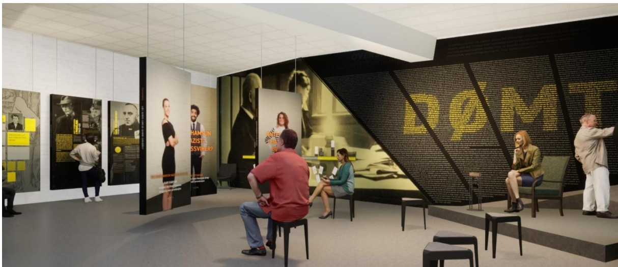
Ny utstilling på Hamsunsenteret.

Hamsunsenterets storsatsing i 5. etasje begynner å ta form. Nedrigging av den gamle utstillinga er i gang, og det vil være byggeaktivitet i tårnet på Presteid til midten av mars. Den nye utstillinga heter «Den kontroversielle Hamsun» og synliggjør hvordan dikteren var kontroversiell i litteraturen og gjennom hele livet.