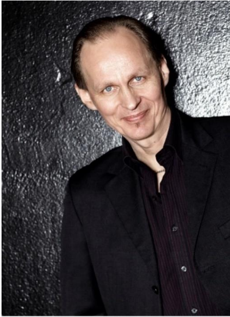
Mikael Niemi