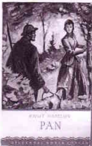
Pan som paperback fra 1954