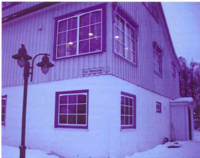
Knut Hamsunggate i Stokmarknes. Veier og gater med Knut Hamsuns navn finnes også i Bodo, Hamarøy, Kongsberg, Mo, Narvik, Raufoss og Trondheim.