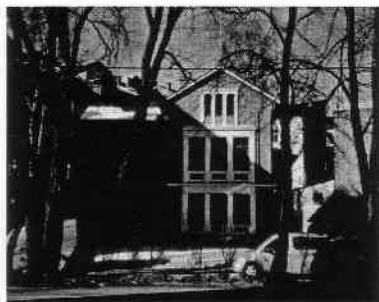
Thereses gate 49 i Oslo: Her bodde Hamsun med Bergljot 1902 – 1904.