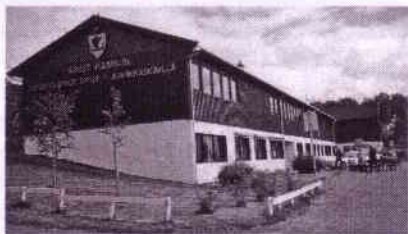
Knut Hamsun videregående skole – joarkkaskåvllå på Oppeid

Knut Hamsun videregående skole kan miste navnet: Knut Hamsun vgs på Hamarøy foreslås av utdanningsråden i Nordland Fylke lagt som filial under Fauske videregående skole. Forslaget innebærer bl.a. at skolen kan miste Knut Hamsuns navn. Skolen selv og alle tre kommuner i Nord-Salten har uttalt seg mot dette forslaget. Det påpekes bl.a. rollen som skolen har gjennom skolens arbeid og