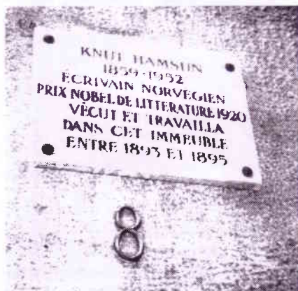
Rue Vaugirard nr. 8 i Paris, ikke langt fra Sorbonne: Her skrev Hamsun "Pan".