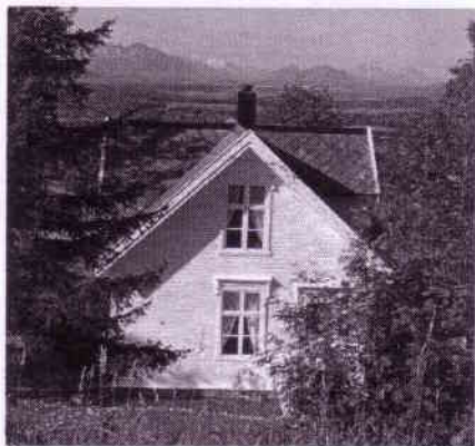
Dikterstua ved siden av Skogheim, hvor Hamsun bodde fra 1911 -1917.

Hamarøy kommune har sikret seg opsjon på kjøp av ”kiosken”, Ham-