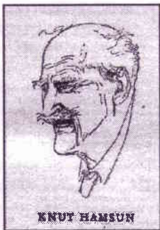
Fra en tysk kalender 1955