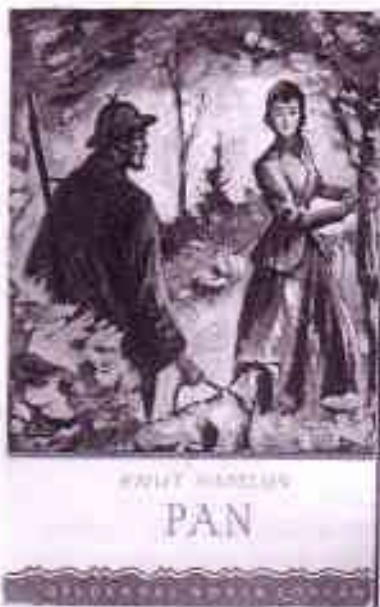
Pan som paperback fra 1954