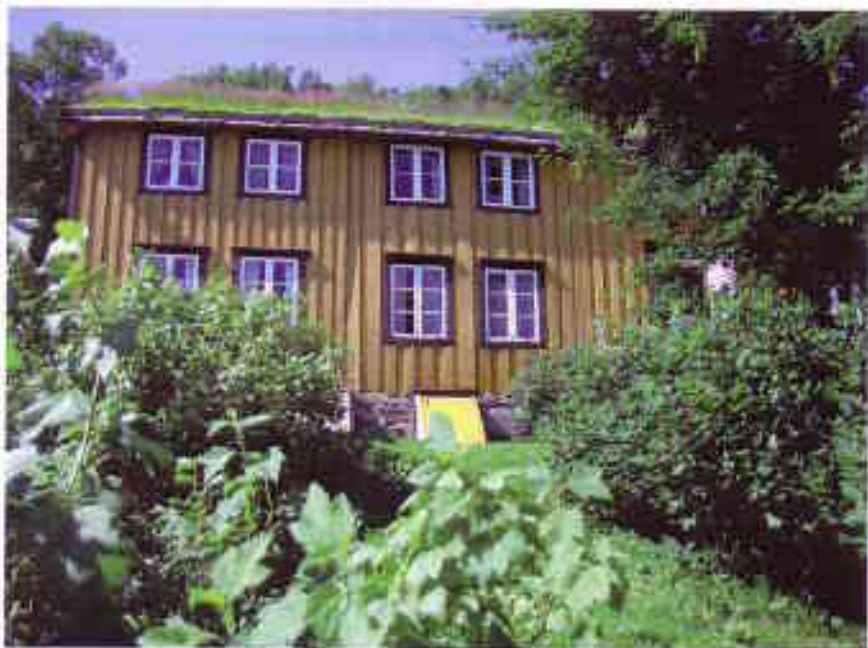
Knut Hamsuns barndomshjem i Hamsund: Her åpnes Hamsundagene på Hamarøy i 2008

Nr. 4/2007 og 1/2008, mars 2008, 20. årgang