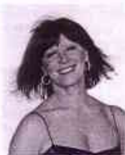
Lill Lindfors skal syngje på åpnings-konserten i Hamarøy kirke.

Variert program: Årets Hamsundager vil gi deg nye unike opplevelser innen litteratur, kunst, teater, musikk, folkeliv med mer. Det er en glede å kunne fortelle at årets åpningskonsert i Hamarøy Kirke blir med Lill Lindfors og Ketil Bjørnstad.