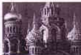
Hamsun-Stiftelsen forbereder jubileumsarrangement i St.Petersburg i 2009

Store Hamsun-planer for Russland i 2009: Hamsun-Stiftelsen i Hamarøy forbereder internasjonale Hamsun-dager i St. Petersburg i Russland i november 2009. Programskissen er meget omfattende og vil kunne resultere i et av de største norske kulturarrangement i Russland noensinne. "Det forutsetter at en rekke nasjonale institusjoner og