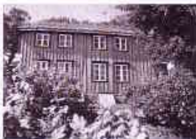
Hamsuns barndomshjem i Hamsund

Nytt åpningssted: Den offisielle åpningen av dagene vil i år bli lagt til Hamsun-gården i Hamsund. Det er hyggelig å kunne vise fram dette spennende området, og kunne få formidle all jobb som har vært gjort med å restaurere gården. I tillegg feirer vi Hamsuns fødselsdag den dagen og foretar kransenedleggelse ved bautaen.