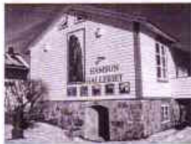
Hamsungalleriet på Tranøy