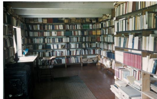
Dikterstua slik den var før bøkene ble sendt til restaurering.